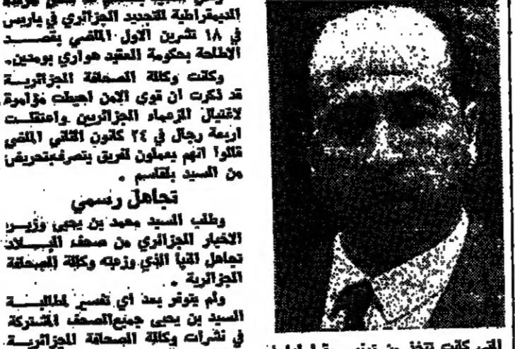
الذي كانت تحتل من تونس مقر لها في تمرد للصينيين هنا ان لحررتي اعداءنا واسعة محددة لا تعترف بأي شيء مما